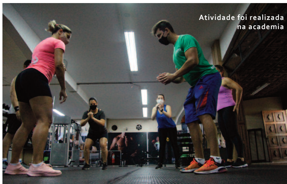
Atividade foi realizada na academia

“Foi uma grande experiência que trouxemos para os nossos associados, um treino diferente, muito técnico e baseado em evidências científicas.” afirmou a