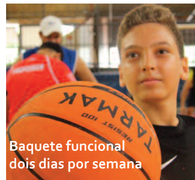
Baquete funcional dois dias por semana