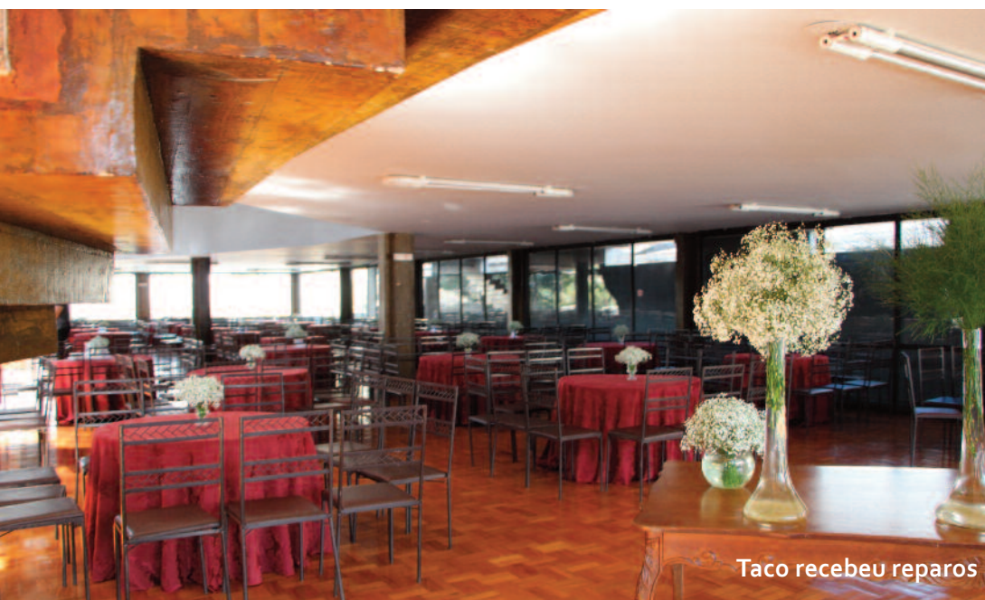
Taco recebeu reparos

Em outubro, dois climatizadores foram instalados no espaço.