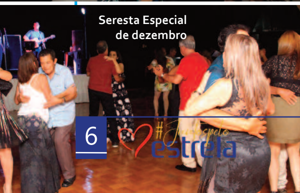
Seresta Especial de dezembro