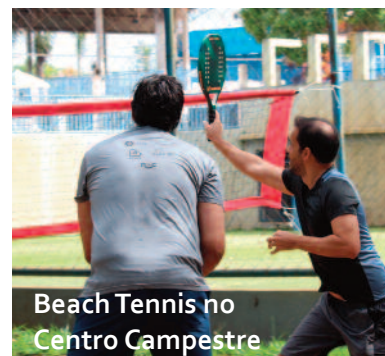
Beach Tennis no Centro Campestre

A atual gestão implementou novos esportes e incentivou novas atividades. Basquete funcional, Beach Tennis e a novo Treino Funcional ganharam espaço. Estrela Night Run e Calistenia também foram realizados para o incentivo das atividades físicas.