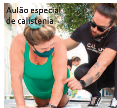
Aulão especial de calistenia

Antigos funcionários se adaptaram ao novo modelo