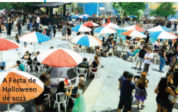
A Festa de Halloween de 2021

O Estrela Kids fica aberto de terça a domingo das 8h às 18h. A faixa etária é de 1 a 12 anos e a entrada é franca.